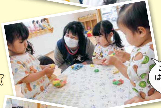
こねこね はじめての 触感