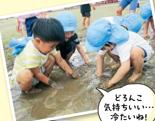
どろんこ 気持ちいい... 冷たいね!