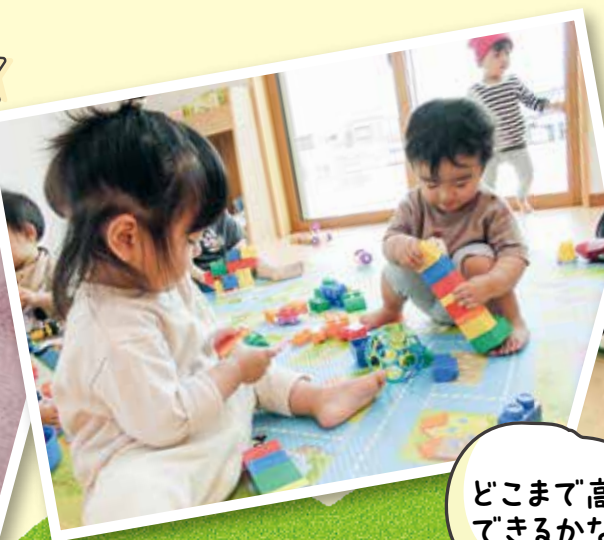
どこまで高く できるかな?