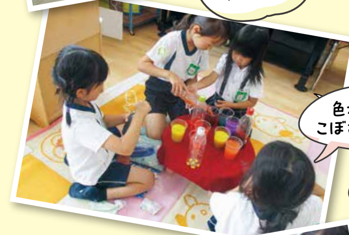
色水ジュース こぼさないように