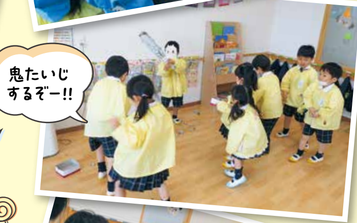
鬼たいじ するぞー!!