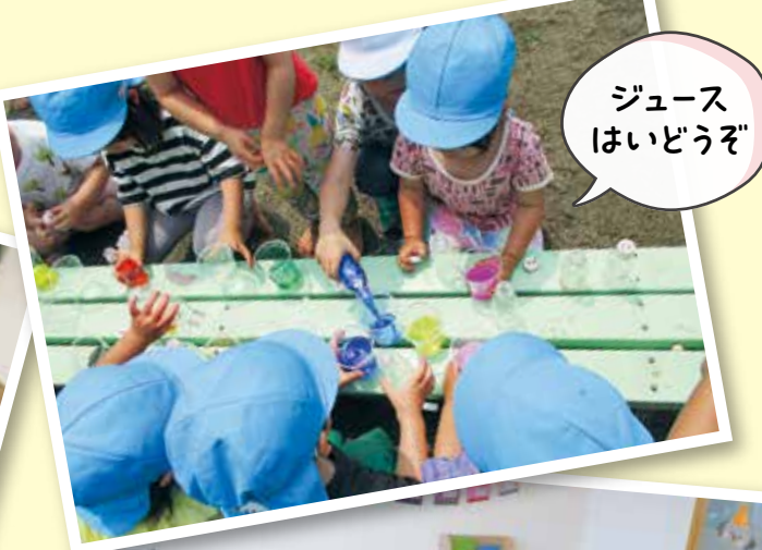
ジュース はいどうぞ