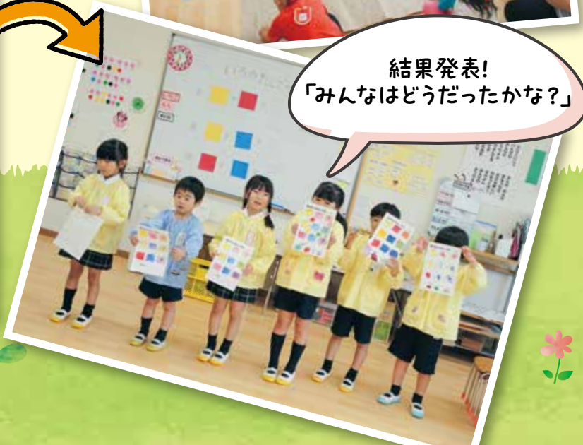
結果発表! 「みんなはどうだったかな?」