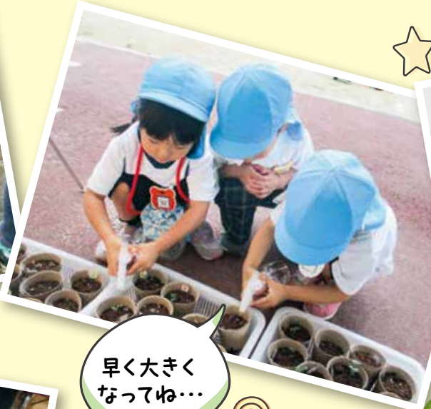
早く大きく なってね...