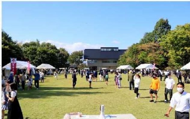
台風16号が通過し、「台風一過」の快晴で大勢のお客さんで賑わい大成功に終わった「第2回専北マルシェ」

10月2日(土)、北上市本石町の詩歌の森公園で物販イベント「第2回専北マルシェ」を開催しました。参加者は、商業科1年生78人、2年生88人の164人が30チームに分かれ販売しました。