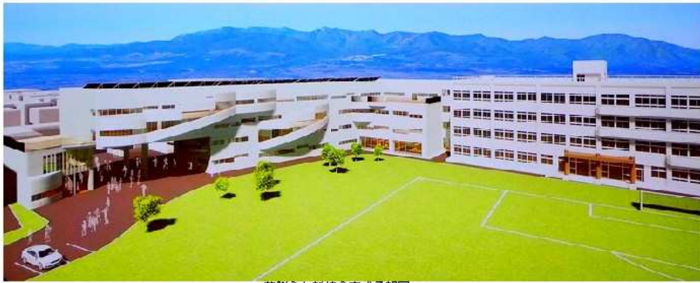
夢膨らむ新校舎完成予想図 2022年(令和4年)4月着工、2023年(令和5年)使用開始予定