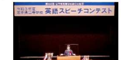
第44回 岩手県高等学校総合文化祭 2021年度 英語スピーチコンテスト

だと感じました。例えば日本には数々の温泉があり、人々に安らぎをもたらす温泉ですが、男女平等と掲げるあまり、すべての温泉が混浴になった。あなたはこのままで通る足を運ぼうと思いませんか。私は行くことに抵抗が生まれると思えています。いくら平等が大切でも、区別すべき事はあるはずです。ジェンダー格差をなくす上で私たちが、どこまでか格差の原因なのかを見極めなければなりません。このように、私たちが日々生活している中で生まれたジェンダー格差は大きな問題でなっています。今すぐ解決する