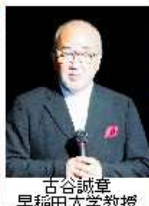
古谷誠章 早稲田大学教授