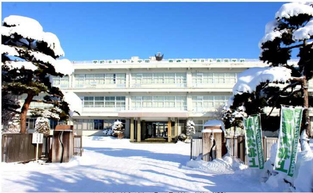
2022年(令和4年)1月19日(水) 午前9時撮影