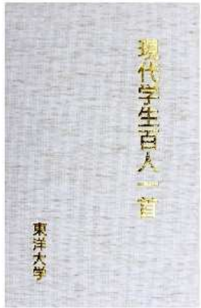
現代学生百人一首