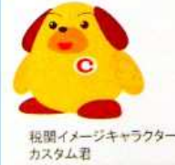
税関イメージキャラクター カスタム君