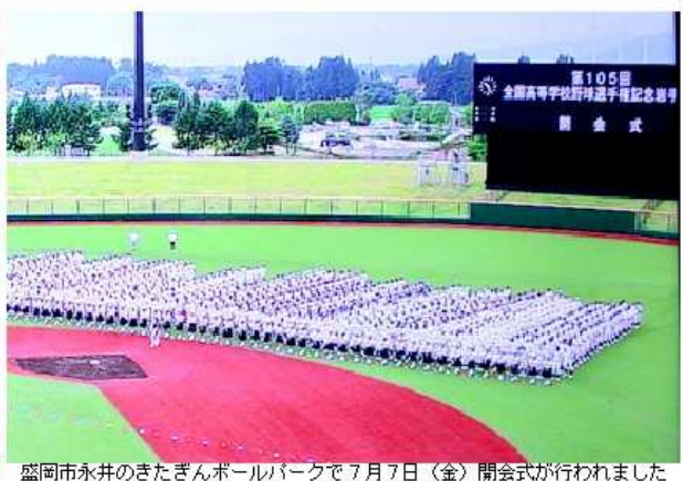
盛岡市永井のきたぎんボールパークで7月7日(金)開会式が行われました